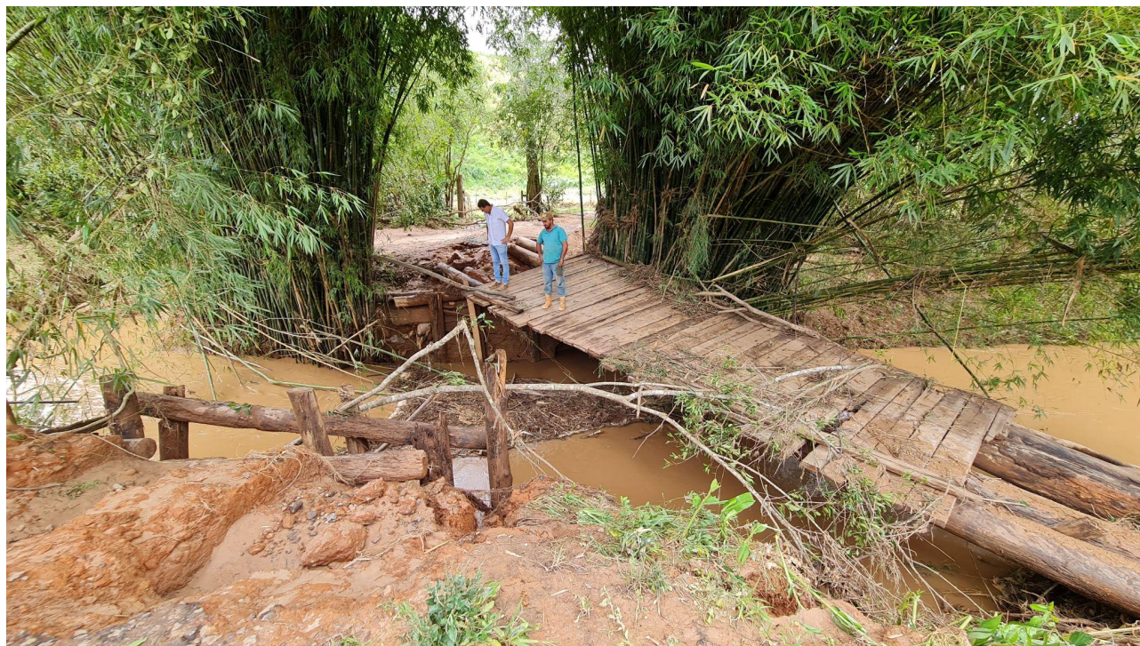
2.6 - Morro nas proximidades da ponte do Brás do Montijo (Acesso alternativo)