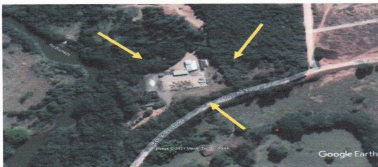
Figura 1: Visão geral do empreendimento de triagem de recicláveis e/ou de tratamento de resíduos orgânicos originados de resíduos sólidos urbanos – Prefeitura de Entre Rios de Minas:

A área total informada no Relatório Ambiental Simplificado - RAS foi 1.200.m². O empreendimento está localizado em área rural e ocupa 50 funcionários na parte operacional e 2 colaboradores na parte administrativa. A área do empreendimento está localizada sob coordenadas Lat. 20°40'28.98"S e Long. 44° 4'43.98"O.