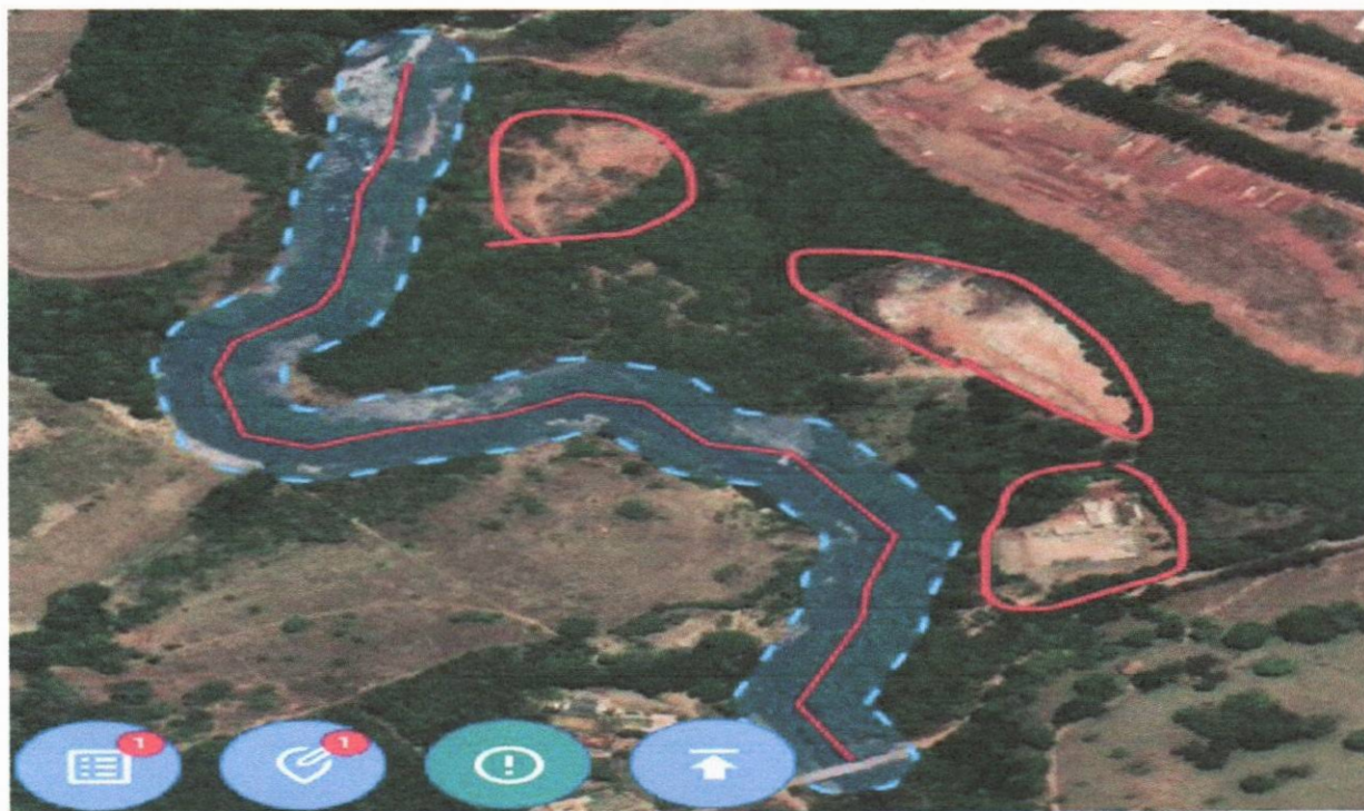
Figura II: Visão geral do empreendimento e sua interface com a APP do Rio Brumado: